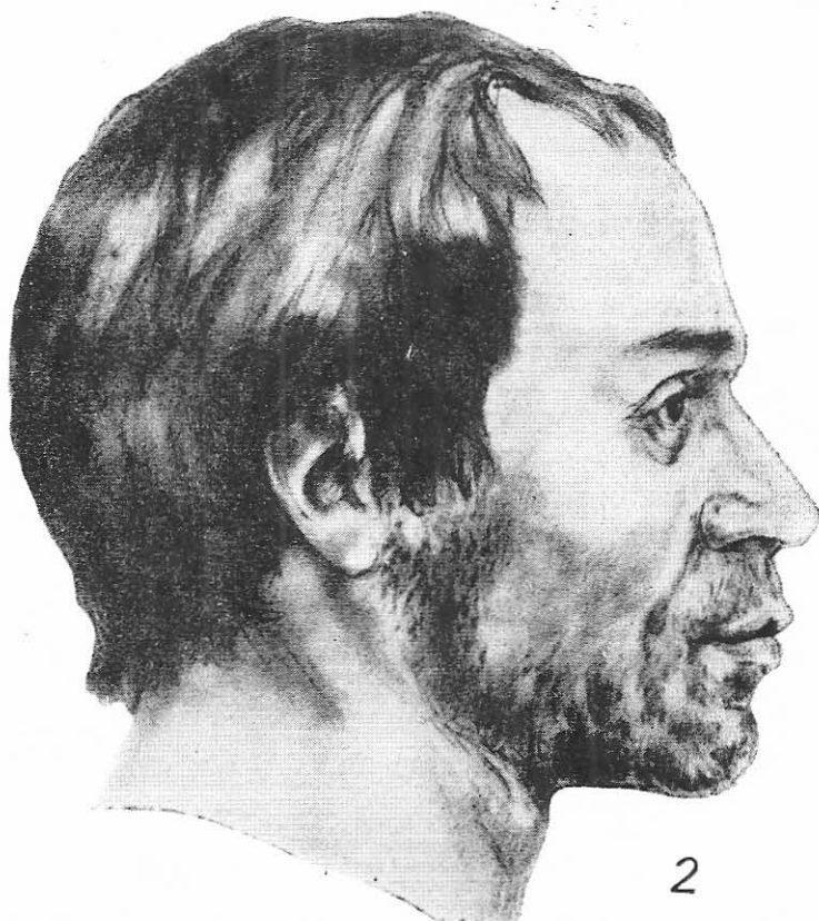
Fig. 1. 1, fixarea grafică a craniului A ; 2, reconstituirea antropologică vitală a craniului A.