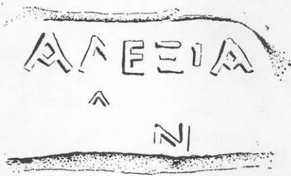
Toarta nr. 3.

Totuși cele două ștampile, cum ușor se poate observa, nu sînt identice, la prima, rîndul al doilea are trei litere (αδα), la a doua, numai două (δα).