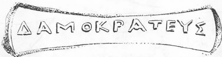
Toarta nr. 4.

Numele Δαμοκράτης apare în lista producătorilor rhodieni (la V. Canarache, nr. 515, 516, 517). Pentru această ștampilă, datarea e greu destabilit.