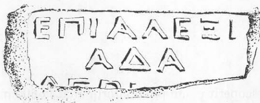
Toarta nr. 2.