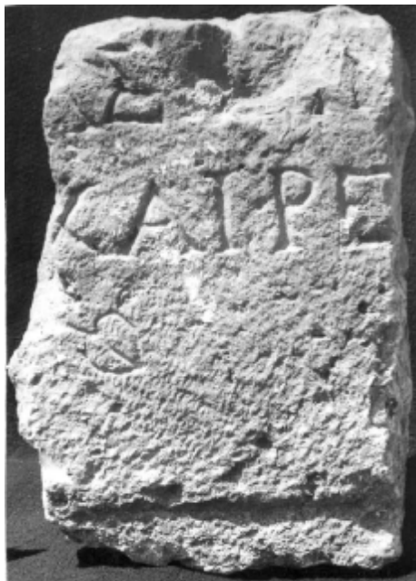
Fig. 4 – Inscripție funerară fragmentară din Tomis