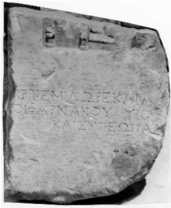
Fig. 2 – Stelă funerară descoperită la Valu lui Traian (jud. Constanța)