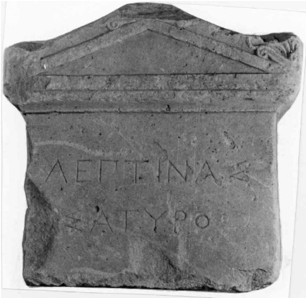
Fig. 1 – Stelă funerară găsită între localitățile Vadu și Traian (jud. Constanța)

Culte egiptene sunt ilustrate la Tomis mai bine de patru secole, din perioada elenistică târzie până în prima jumătate a sec. al IV-lea p. Chr., cu dovezi mai numeroase din sec. II-III p. Chr., între care se înscrie acum o nouă piesă.