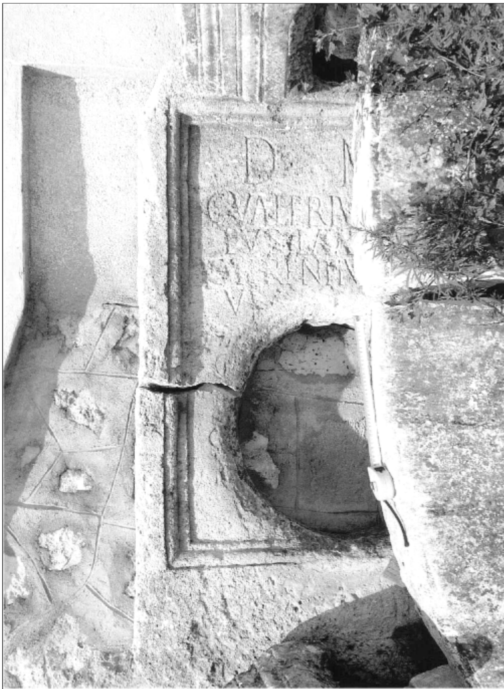
Fig. 2- Fotografia pietrei de mormânt (stadiul din 29. 07. 2000)